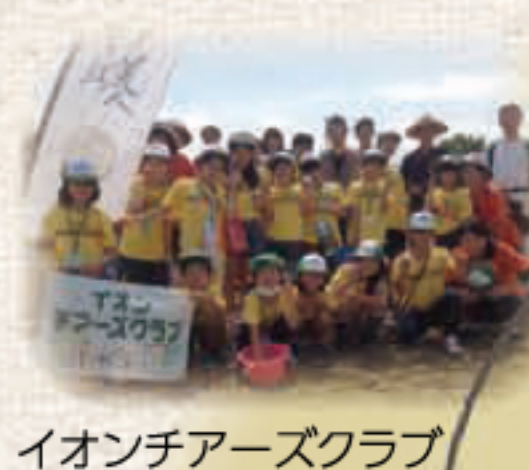
イオンチアーズクラブ