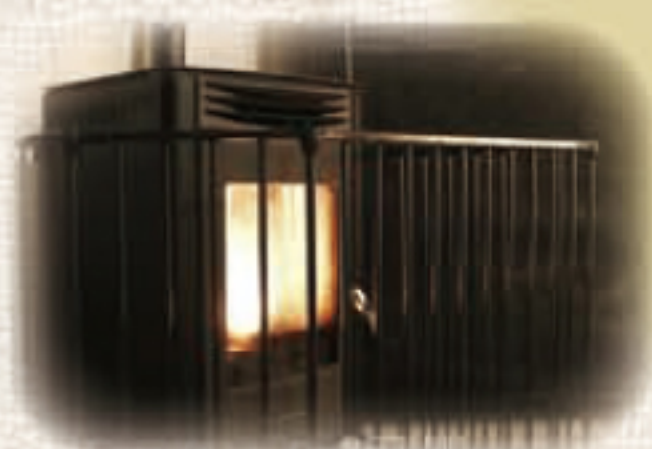
ペレットストーブ 竹紛ペレットを燃料とする 環境対策型暖房器具