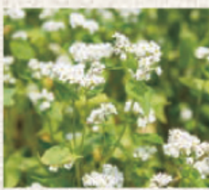
「知多美人そば」の花