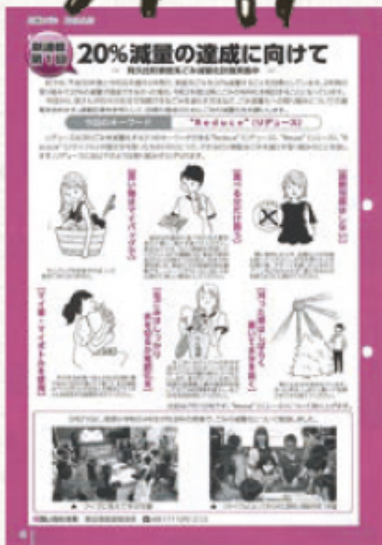
阿久比町広報 環境についての連載