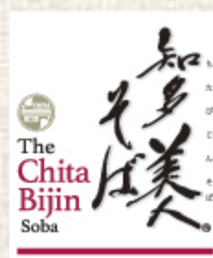
I become beauty in the Chita peninsula.