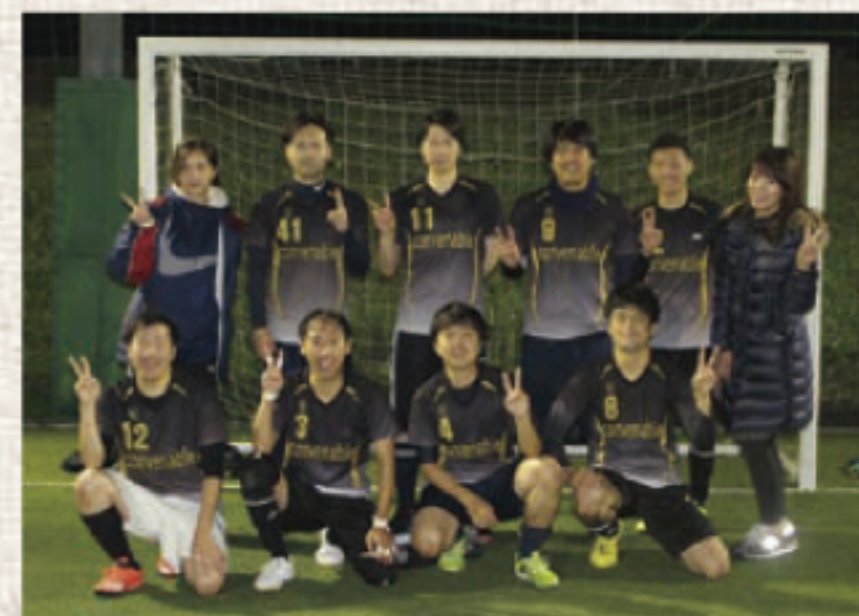
大谷さんが所属するフットサルチーム

A 休日は、だいたい外に出ます。フットサルチームに所属しているので試合をしたり、チームのみんなと遊びに行ったり、サッカー観戦したりして出かけていることが多いです。