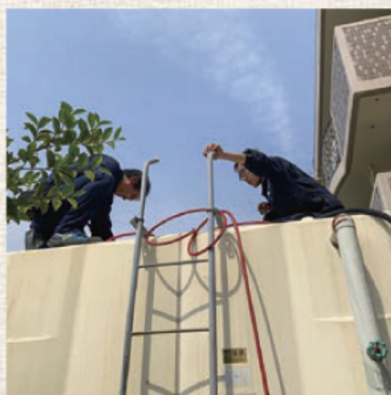
清掃作業の打合せ中

貯水槽・給水設備メンテナンスは、飲み水や手洗い用の水など、清潔な水を人に届けるために、マンションやビルの貯水槽や給水管を管理するお仕事です。きれいな水が通るとはいえ、放っておくと、付着物の発生や劣化などのトラブルが起きる可能性があるため、こうした上水道関連設備のメンテナンスを行っています。