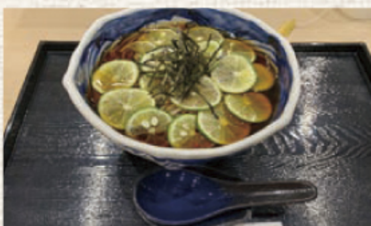
笠庵オリジナルすだちそば