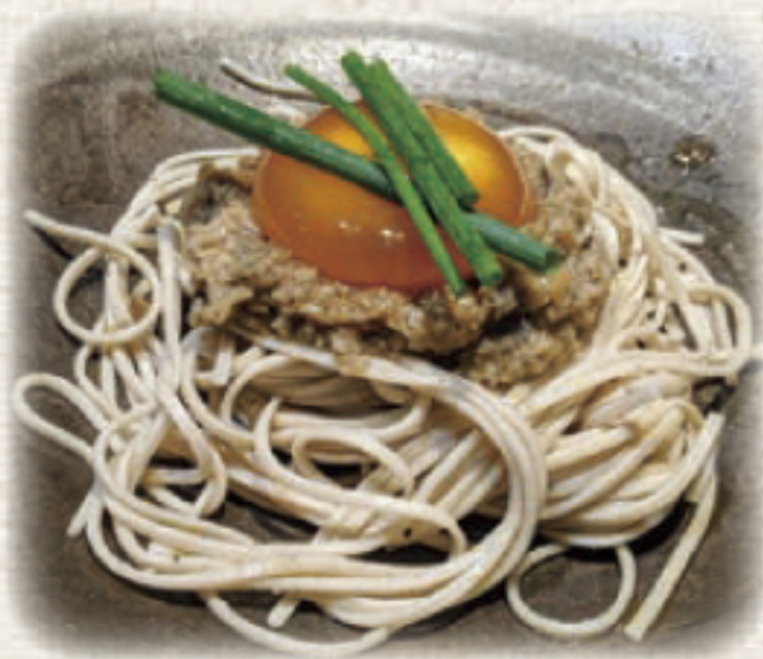
知多美人そばの冷製カップリーニ仕立てきのこのラグーカルボナーラ風

第6回目となる知多美人そば収穫祭。阿久比町にあるイタリアンレストラン トラットリア・ラ・ピアンタさんにて11月23日に開催されました。多くのお客様にシェフ考案の知多美人そばを使ったイタリアンの創作料理をお楽しみ頂きました。シェフには毎年違う、知多美人そばを利用した創作イタリア料理を提供していただき感謝いたします。今年も11月23日に第7回あぐいコラボレーション企画での収穫祭開催を予定しております。知多半島の他の市町でも知多美人そばと地元食材と共に提供できる場所と飲食店を探しておりますので、ぜひご興味のある飲食業種の方々は、一緒に盛り上げていただけたら幸いです。