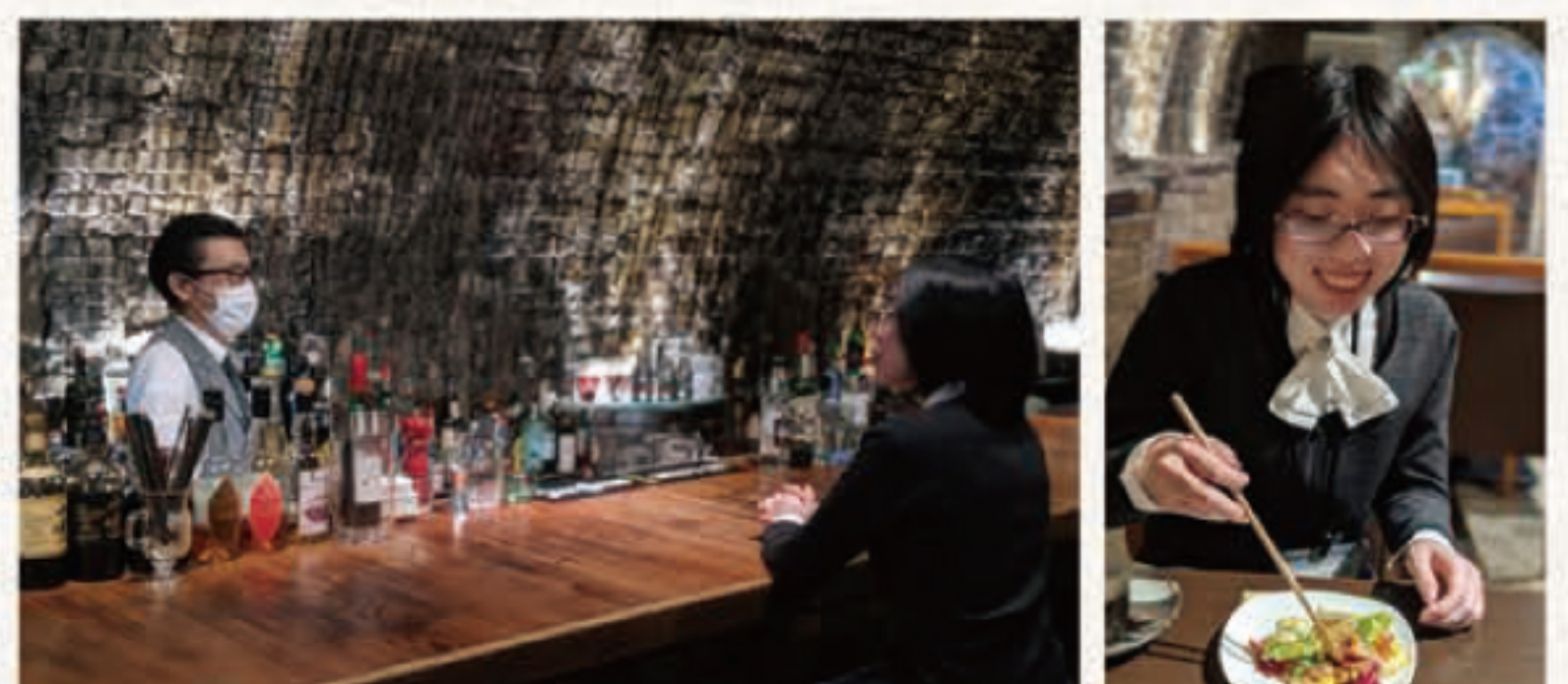
「食」でアグメントとつながる「共栄齋」さんへのインタビューは裏面にて