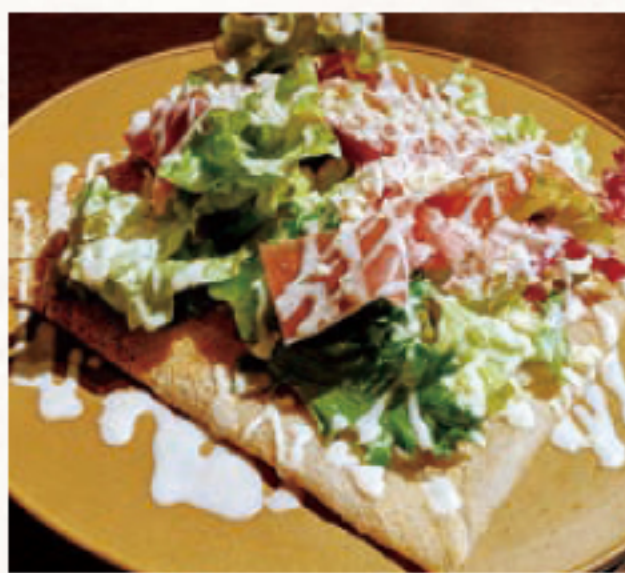
知多美人そば粉を使用した生ハムのガレット

清水レポート 古い窯でできた独特の壁がライトアップされ、素敵なお店でした。ガレットは初めて食べましたが、そば粉でできた生地に生ハムや野菜を巻いて、ぜひ皆さんに食べてほしい美味しさでした!