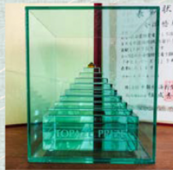
トパーズ賞オブジェ

中部経済新聞社による東海地方の優れた女性経営者を表彰する「第30回中経トパーズ賞」を愛知県の代表として受賞いたしました。初めは受けていいのかわり悩みましたが、これは会社全体の取り組みに対しての賞であり地域の方々や社員みなさんに支えられたおかげでいただいたという感謝の気持ちで受けることにいたしました。受賞式はコロナ禍により中部経済新聞社の恒成社長より弊社へお越しいただき表彰状と記念の天然石トパーズ付きのオブジェをいただきました。受賞のきっかけとなったアグエコプロジェクトは、アグリカルチャー、エコロジー、エコノミーの3つを兼ね備えた持続可能な循環型社会を目指した取り組みで、地域社会に貢献したいという想いでスタート